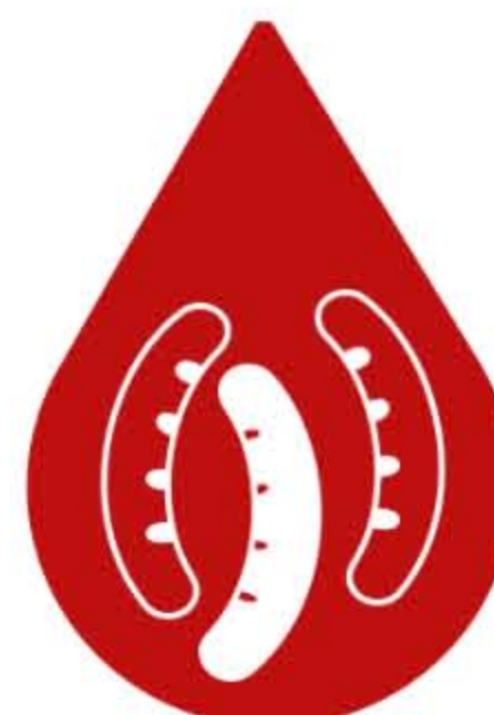
TŁUSTE MIĘSO, WĘDLINY, PARÓWKI