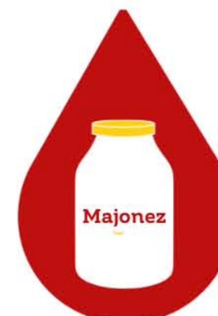
MASŁO, ŚMIETANA, MAJONEZ

Zgłoś się do Regionalnego Centrum Krwiodawstwa i Krwiolecznictwa w Lublinie, najbliższego Oddziału Terenowego lub weź udział w akcji terenowej i uratuj komuś życie!