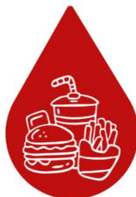
FAST FOOD, CHIPSY